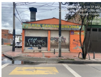
Fachada del establecimiento por Calle